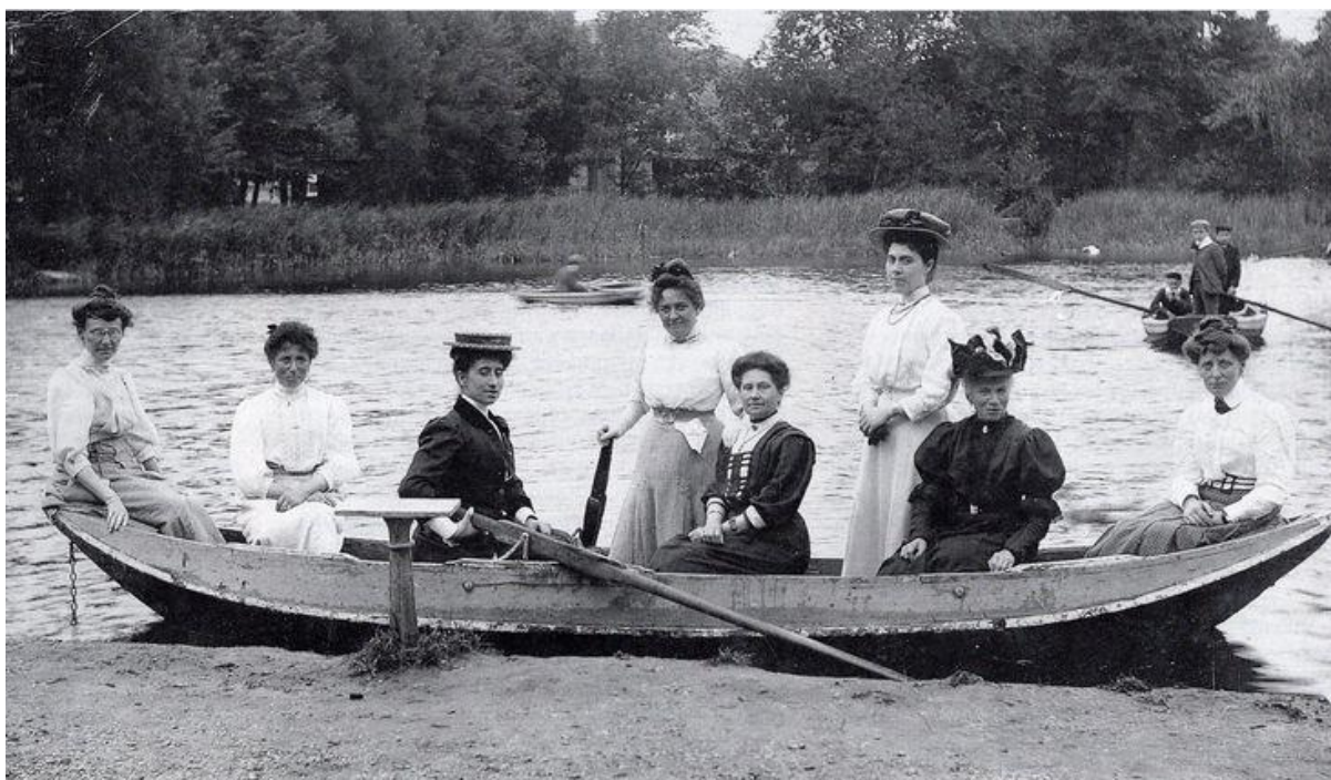
Omstreeks 1900 | Spelevarende dames uit de gegoede burgerij op de kalm vlietende Mark.

Aan het eind van de 19 e , begin 20 e eeuw raakte het maken van uitstapjes door de gegoede burgerij in zwang. Ginneken, dat in die tijd uitgroeide tot een welvend kuuroord, was een geliefde trekpleister. Dat had alles te maken met de gezonde lucht boven het Markdal en het Mastbos en de hotels/restaurants die er verzezen, zoals Dennenoord, Mastbosch, de Boschwachter en Boschhek. Het was ook de tijd waarin BM bijvoorbeeld in de tuinen van Kasteel Bouvigne of Kuuroord Mariëndal gratis toegankelijke zondagmiddagmatinee s organiseerde.