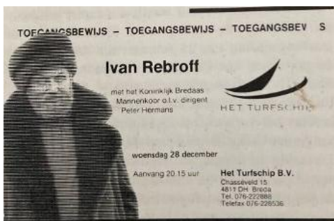
Ivan Rebroff (1931-2008) op het toegangsbewijs.

Met de opening van Zalencentrum Turfschip aan de Vlaszak in 1969 verloor Concordia haar monopolypositie en werd ook het Turfschip voor BM het toneel voor onder meer een succesvolle reeks kerstconcerten. Meer hierover in hoofdstuk 15 – 'Kerstmis in Europa'. In dit hoofdstuk gaat de aandacht in het bijzonder uit naar twee concerten waarbij de Oranjezaal met ruim 1200 stoelen te klein bleek om alle belangstellenden te herbergen. Het betreft een