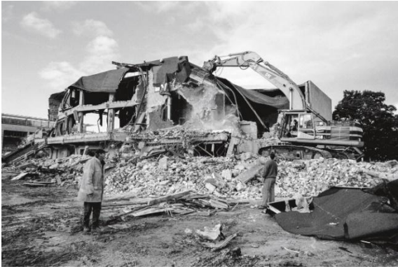
Foto van de sloop van 't Turfschip in 1998

De bouw van het prestigieuze Chassé Theater aan de Claudius Prinsenlaan, dat in 1995 haar deuren opende, betekende op zijn beurt het begin van het einde voor het inmiddels verouderde en onderkomen Turfschip. In 1998/99 werd het hele complex gesloopt. Aan de opening van het nieuwe theater ging evenwel veel politiek gekrakeel vooraf en de financieel uit de klauw lopende bouw ervan kostte ook twee wethouders van cultuur de kop. Inmiddels is het architectonisch juweel van de hand van Herman Herzberger