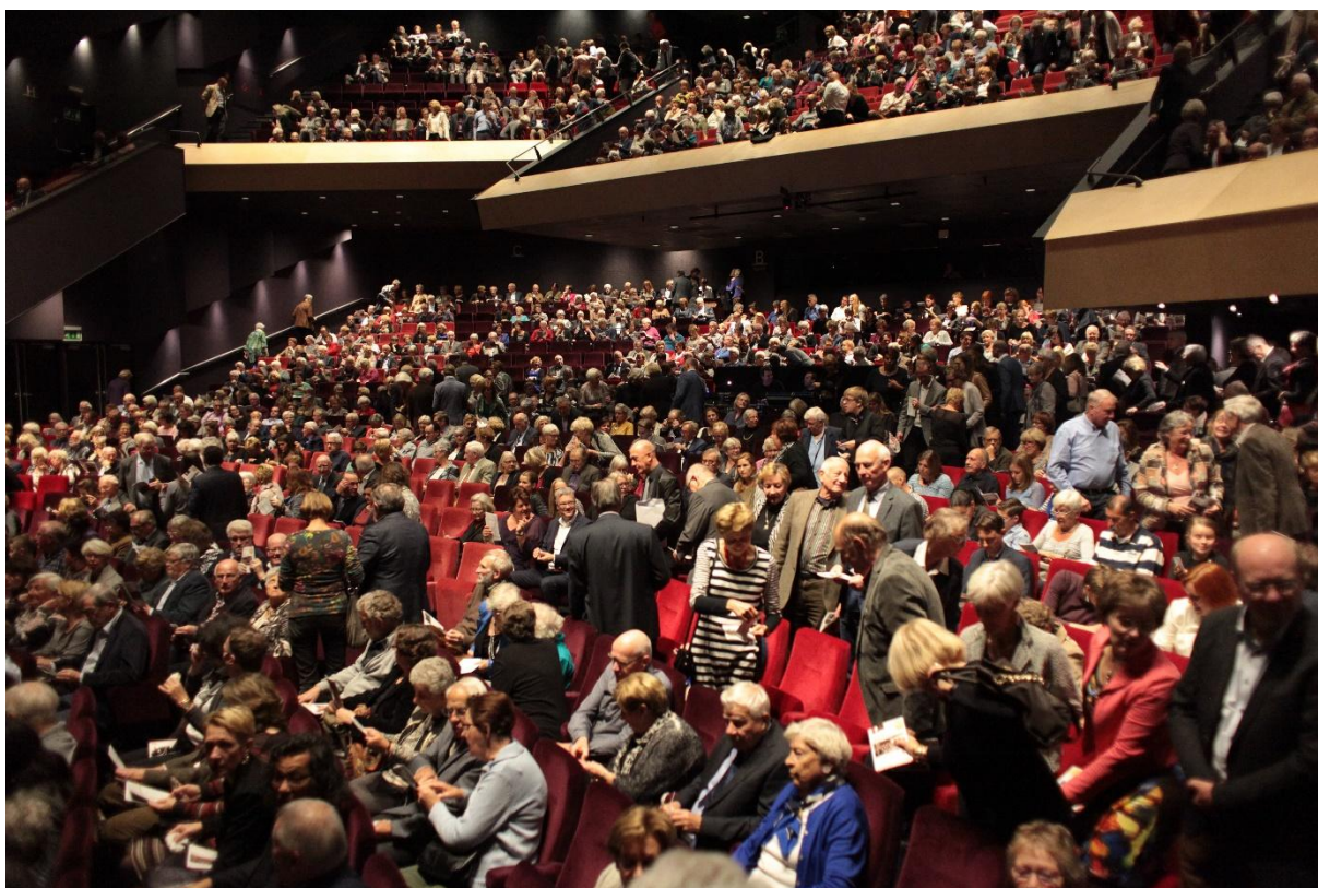
Volle bak in de grote zaal van het Chassé Theater bij het jubileumconcert 150 jaar BM in 2015

Ieder koor wil haar zangkunsten etaleren aan een publiek. En hoe voller een zaal, hoe trotser het is. Maar voor elk koor geldt dat, bij wijze van spreken, ‘de weg van bovenzaal naar grote zaal’ een lange is. Onbekend maakt onbemind immers en je moet nu eenmaal ergens beginnen met het ‘aan de weg timmeren’. Voor BM was dat ‘ergens’ in een bovenzaaltje van koffiehuis Het Gouden Kruis aan de Veemarktstraat 2a. In dit zaaltje van 13 bij 5,5 m (dat tevens dienst deed als ons eerste repetitielokaal – zie bij hoofdstuk 5) gaf BM op 25 februari 1866 haar allereerste concert ten beste.