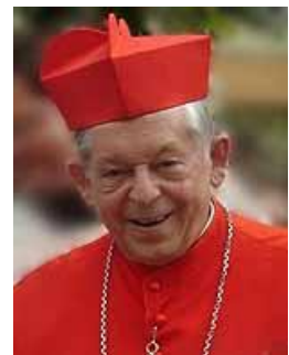
Kardinaal (en aartsbisschop van Warschau) Józef Glemp (1929 – 2013)

Oude tijden herleefden met een gratis toegankelijk volksconcert ter gelegenheid van de 750 e verjaardag van Breda op de zonnige midzomeravond van 2002. Het BM-optreden, dat in samenwerking met Koninklijke Militaire Kapel (KMK) op het terrein van de KMA werd gegeven, werd door om en nabij 1200 belangstellenden bijgewoond. Deze Midsummernight op de Parade was een bijzondere belevenis, maar achteraf beschouwd tevens de laatste