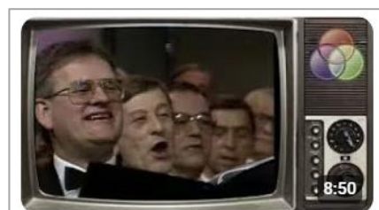
BM 1989 TV optreden in KRO programma Columbus