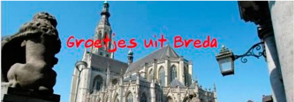
Augustus 2013 | Foto uit het Vlaams-Nederlandse tijdschrift HUMO bij een artikel over Vanthilt on Tour in Breda

uitgezonden TV-optreden van BM was in 1975 toen het koor in Cork deelnam aan een groot internationaal concours in deze Ierse havenstad (zie ook bij hoofdstuk 4 onder 'Au revoir 'meneer Marcel'). Impliciet werd daarmee reclame gemaakt voor Breda, zou je kunnen zeggen. Expliciete aandacht voor de stad was er in het Belgische TV-programma Vanthilt on Tour in de zomer van 2013. Voor deze live-uitzending had de VRT haar studiotent op het Kasteelplein opgeslagen.