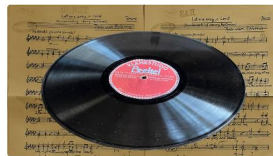
BM 1956 Een verloren gewaande radio-opname van Koninklijke Zangvereniging Breda's Mannenkoor